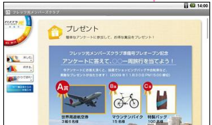
新着情報表示（画面例）